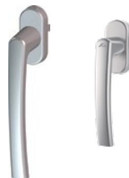
Dos tamaños de manilla para ventana o balconera

Un mismo diseño de manija para todos los tipos de aperturas proporcionan a su vivienda un aspecto uniforme y elegante.